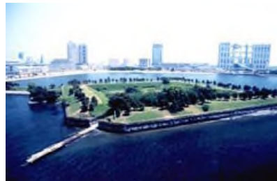
khu công viên Odaiba