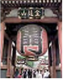
Chùa Senso (Asakusa)