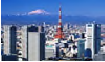
Trung tâm thành phố Tokyo