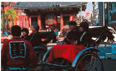
khu phố cổ Asakusa

NARITA Airport Cách trung tâm Tokyo 70 km