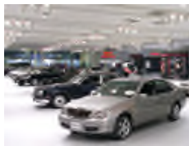
Phòng triển lãm xe