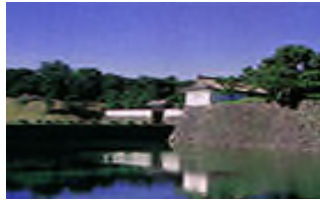
Ngoại thành Hoàng cung