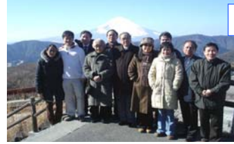
Núi Phú Sĩ